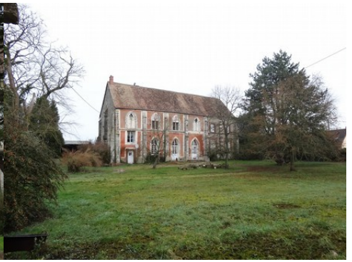
La façade nord depuis le jardin arboré