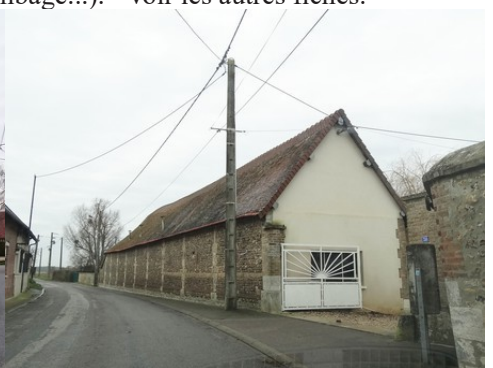
Les bâtiments agricoles voisins du manoir D'autres exemples de bâti agricole