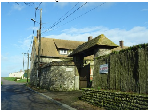
Un portail d'entrée couvert et son mur