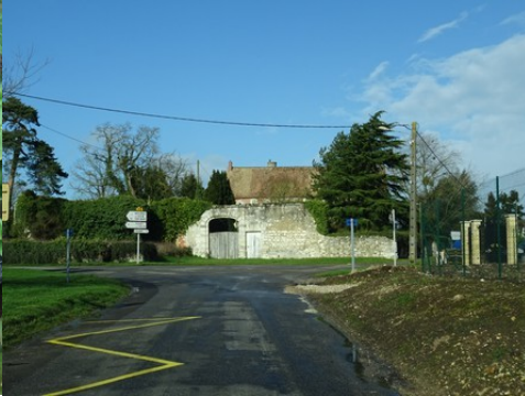
Le portail d'entrée vu de la route