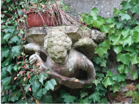
Un vestige sculpté de la chapelle