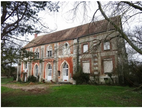
Des vues de la façade sud du logis