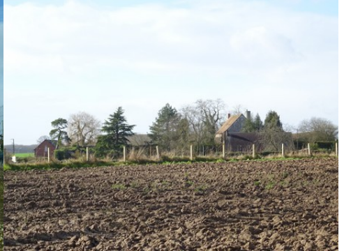
Le manoir vu des champs à l'Est

Pour la zone en rose foncé dans le périmètre de 500 m