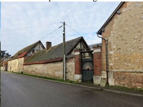
Le bâti rural de Mezières en Vexin